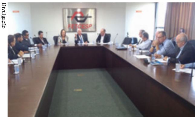
Reunião dos conselheiros Sest Senat São Paulo

Na reunião, os conselheiros ainda analisaram o desempenho das unidades operacionais na prestação de serviços nas áreas de desenvolvimento profissional, saúde, esporte e lazer.