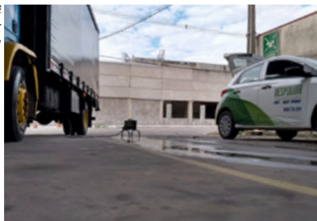
Equipamento para avaliação veicular ambiental