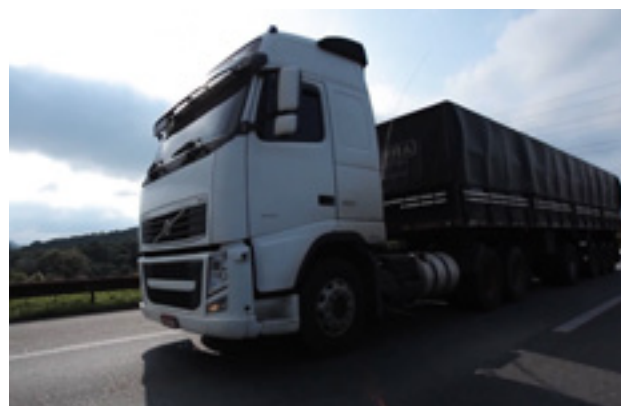
Vídeo de valorização do TRC no site www.fetcesp.com.br