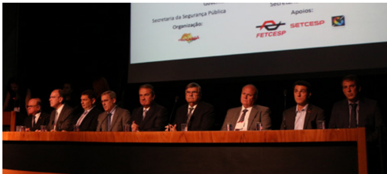
Autoridades na abertura do Seminário Estadual de Crimes de Cargas