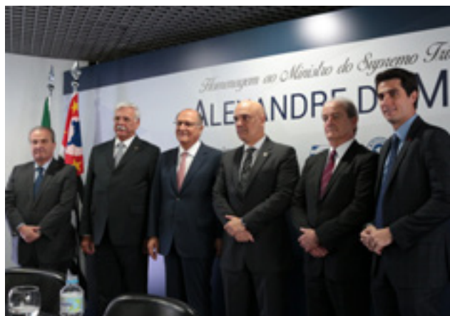
Márgino Alves Barbosa Filho, secretário de Segurança Pública; Flávio Benatti, presidente da FETCESP; Governador Geraldo Alckmin; Ministro Alexandre de Moraes; José Hélio Fernandes, presidente da NTC&Logística; Tayguara Helou, presidente do Setcesp

A FETCESP participa do Conselho de Defesa do Contribuinte do Estado de São Paulo (Codecon) que promove reuniões mensais, com o poder legislativo na Assembleia Legislativa e com o Governo do Estado. O objetivo é o de aperfeiçoar a matéria tributária e seu processo administrativo. A FETCESP, também participou do primeiro Congresso do Codecom, realizado em 6 de dezembro, em São Paulo (SP).