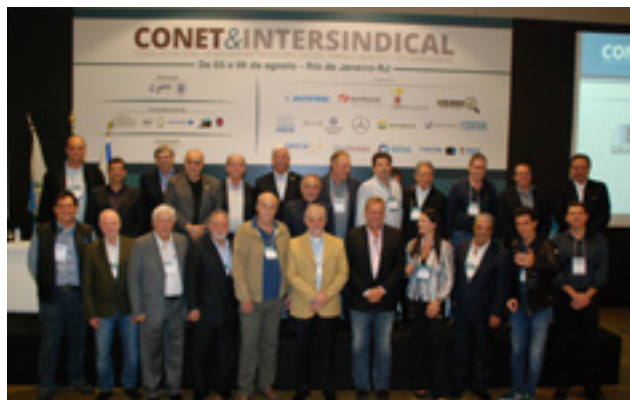
Lideranças do setor, empresários e executivos de entidades do Estado de São Paulo no Conet&Intersindical no Rio de Janeiro

Outro fato marcante no Sest Senat é o plano de ampliação e adequação da rede de atendimento. A projeção é que nos próximos dois anos estejam em funcionamento mais de 200 Unidades. Em São Paulo passarão de 29 para 40 unidades e o projeto já está em andamento.