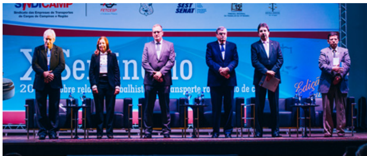
Autoridades na abertura do X Seminário sobre Relações Trabalhista do TRC

O Setcar (Sindicato de Araraquara) sediou a reunião em 24 de março e comemorou 30 anos de atuação em evento de confraternização com a presença lideranças do setor e empresários da região. Em 28 de abril a reunião foi realizada nas dependências da Braspress. No dia 18 de maio, o Sindicamp (Sindicato de Campinas) recebeu a diretoria da FETCESP e no dia seguinte promoveu o X Seminário Relações Trabalhistas.