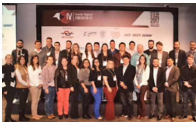
Representantes de núcleos da Comjovem no Encontro Regional São Paulo