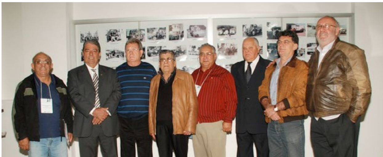
Lideranças do setor em evento na sede do Setcarso em 2009

Hoje, os associados do Setcarso contam com vários serviços e benefícios, como isenção da Contribuição Assistencial Patronal; Disk Denúncia; Central de Informações para esclarecer dúvidas; Assessoria Jurídica; Exames psicológicos para admissionais e periódicos e Programa Despoluir.