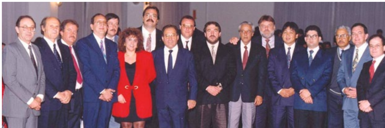
Primeira diretoria do SETRANS, em 1992

A integração dos parceiros do Setrans com os empresários tem sido uma constante. Através do tradicional Programa Ação ABC Empresarial, lançado em 2005, o Setrans promove palestras e confraternização entre os associados e parceiros. Nestes encontros são tratados de temas diversificados visando atualizar os empresários sobre as tendências de mercado sobre gestão, tecnologia e legislação entre outros assuntos.