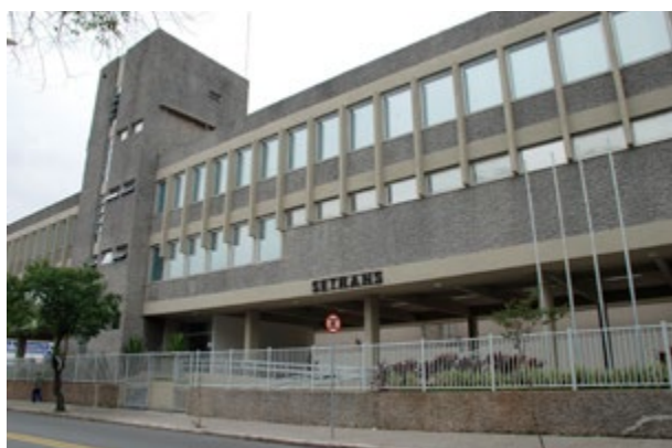
Sede do SETRANS, no Bairro Fundação, em São Caetano do Sul/SP