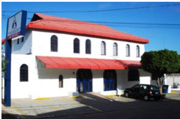
Sede do Setcarso, no Bairro Trujillo, em Sorocaba/SP

Nesta edição, FETCESP em Destaque registra alguns acontecimentos da atuação dedicada das diretorias dos Sindicatos do ABC (Setrans) e Sorocaba (Setcarso).