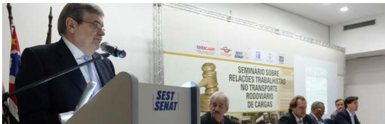
Autoridades na abertura do Seminário