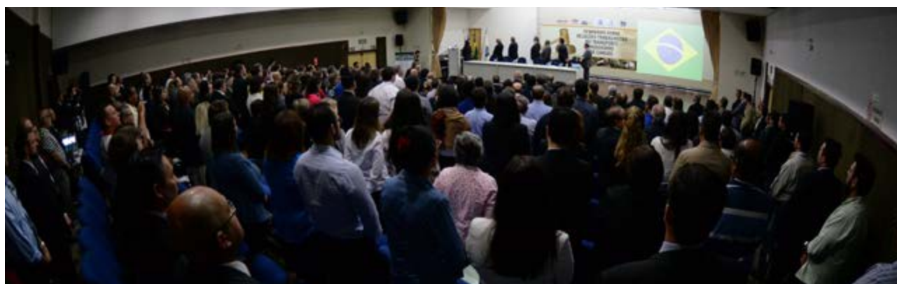
Empresários, executivos e advogados do setor e integrantes do judiciário

O Sindicato das Empresas de Transportes de Cargas de Campinas (Sindicamp) realizou o IX Seminário sobre Relações Trabalhistas no Transporte Rodoviário de Cargas, no último dia 13 de maio. Participaram do evento lideranças do setor, empresários, executivos e advogados que atuam no transporte e integrantes do judiciário do Tribunal Regional do Trabalho (TRT) da 15ª Região.