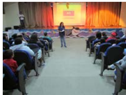
Café da manhã, palestra e peça teatral infantil no dia do trabalhador