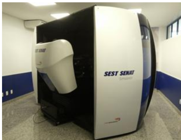
Simulador de direção para o aperfeiçoamento de motoristas

A Unidade Vila Jaguará tem mais uma ferramenta pedagógica, com tecnologia de ponta, com a instalação do Simulador de Direção Veicular. O equipamento é voltado para o aperfeiçoamento de motoristas de caminhão, carreta e ônibus. Possui um cockpit equipado com banco, controles como volante, pedais e painel interligados. As imagens que o condutor tem da via dentro do veículo virtual são projetadas em tempo real, com cenários criados a partir de mídias digitais (árvores, placas, topografia). O objetivo deste projeto é o de alcançar como resultado, a partir da capacitação, o aperfeiçoamento contínuo e, a prevenção de acidentes, contribuindo para a segurança viária. Os cursos oferecidos, gratuitamente, para os trabalhadores do transporte são os seguintes: Condução Segura e Econômica; Condução em Situações de Risco; Tecnologias Embarcadas no Veículo; Transporte de Passageiros (ônibus) e Cargas Especiais (caminhão) e Manobra de Veículo.