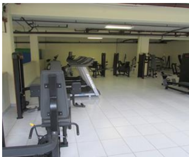
Academia de ginástica com vários equipamentos

A vida agitada provoca o sedentarismo nas pessoas e prejudica a saúde. Para contribuir com a mudança deste comportamento a Unidade Vila Jaguará inaugura no próximo dia 20 de fevereiro a academia de ginástica. A frequência das pessoas, neste espaço, possibilitará muito mais do que apenas praticar exercícios. A variedade de equipamentos permitirá que o aluno exercite a musculatura e trabalhe o alinhamento e a sustentação do corpo, melhorando a postura. Um importante diferencial é que o aluno terá o tempo todo, um profissional da área de Educação Física para acompanhar e orientar sobre a postura correta na realização de exercícios adequados e necessários para a sua realidade. A frequência regular na academia irá melhorar o desempenho, o descanso e a qualidade de vida do aluno. Está comprovado que um condicionamento físico adequado beneficia o sono, a postura, a autoconfiança, a autoestima, o humor e as relações sociais.