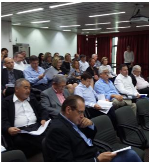
Conselheiros do Sest Senat e gestores de Unidades Operacionais paulistas