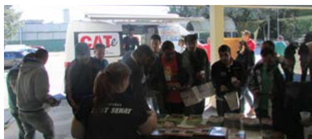
Atividades da Unidade no Dia do Motorista