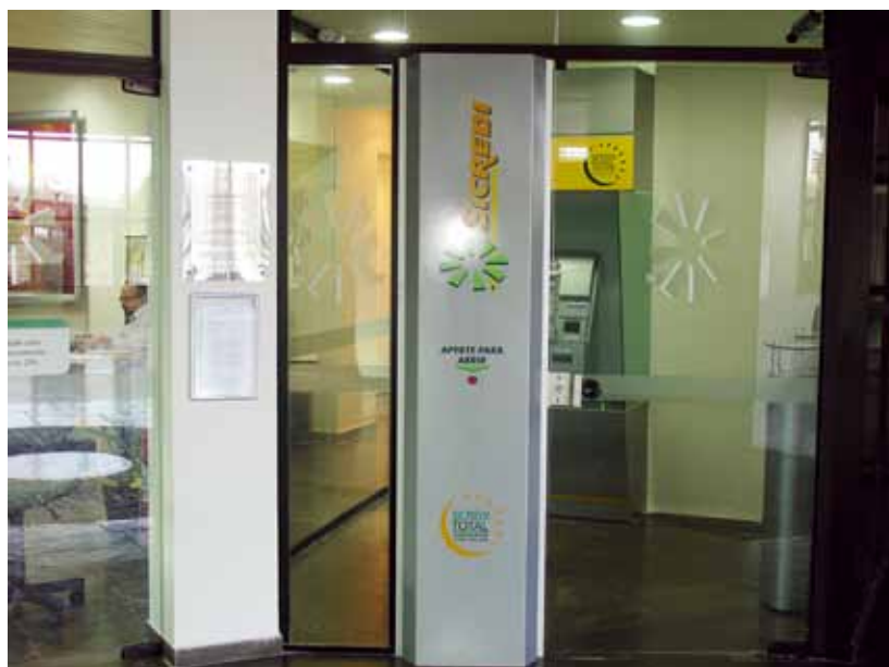
Aspectos da entrada da Unidade Sicredi Fetcoop, no Palácio do TRC

mais de 1,8 milhão de associados, sendo mais de 29 mil no Estado de São Paulo. O valor do crédito no Brasil somou mais de R$ 12 trilhões, enquanto o do ativo ficou em mais de R$ 17 trilhões.