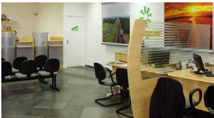
Estrutura de um banco para atender os associados

Com duração até dezembro serão realizados 473 sorteios para premiar os associados com TVs, notebooks, motocicletas, videogames e, no sorteio final em dezembro, com cinco picapes Toyota Hilux.