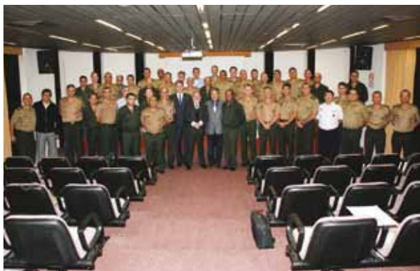
Coronéis participantes do Curso de Política, Estratégia e Alta Administração do Exército da Eceme, palestrantes e presidentes de sindicatos

Com o objetivo de apresentar um perfil da infraestrutura de transporte no Brasil, a FETCESP recebeu participantes integrantes do Curso de Política, Estratégia e Alta Administração do Exército (CPEAEx), da Escola de Comando e Estado-Maior do Exército Brasileiro (Eceme) para um Seminário, no último dia 13 de junho.