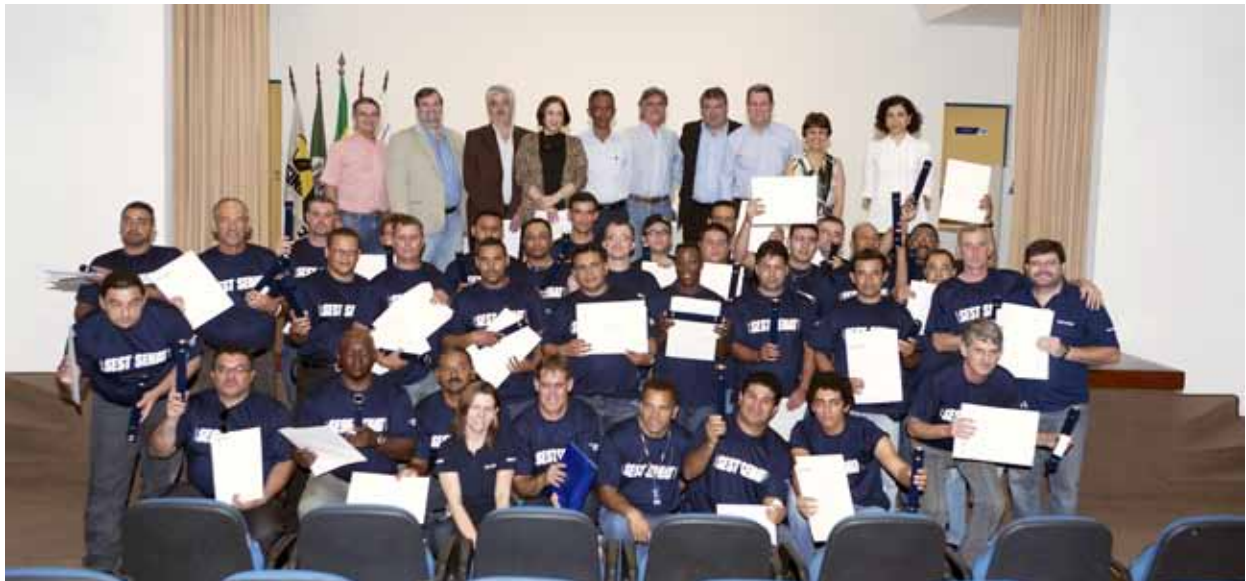
Formandos com os instrutores, empresários e autoridades

Uma parceria bem sucedida foi realizada em Piracicaba entre o Sindetráp (Sindicato das Empresas de Transporte de Cargas da região), o Sest Senat da cidade, a Prefeitura e o Ministério do Emprego e Trabalho. Todos se uniram para desenvolver um curso especial de Formação de Condutores de Veículos para o Transporte Rodoviário de Cargas.