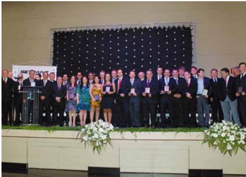
Parceiros do Setrans recebem homenagens da diretoria

Com muita alegria e clima de união entre empresários e parceiros do transporte e autoridades regionais, o Setrans realizou o jantar de confraternização, no último dia 2 de dezembro, no Buffet Samyr, em São Caetano do Sul/SP.