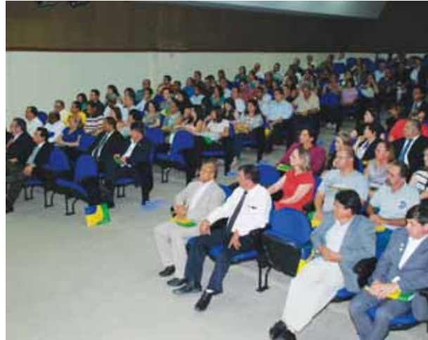
Profissionais que atuam no transporte no evento de lançamento do Programa

Os cursos incluem aulas presenciais de direção e trânsito (para quem possui a carteira de habilitação profissional),