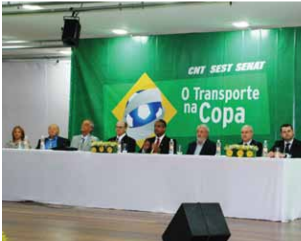
Autoridades elogiaram a iniciativa do Sest Senat

O Brasil tem se preparado cada vez mais para organizar e festejar a Copa do mundo de 2014 e o Sest Senat contribuiu com os preparativos através do Programa O Transporte na Copa, lançado no último dia 1º de dezembro, em São Paulo/SP, na Unidade Vila Jaguara.