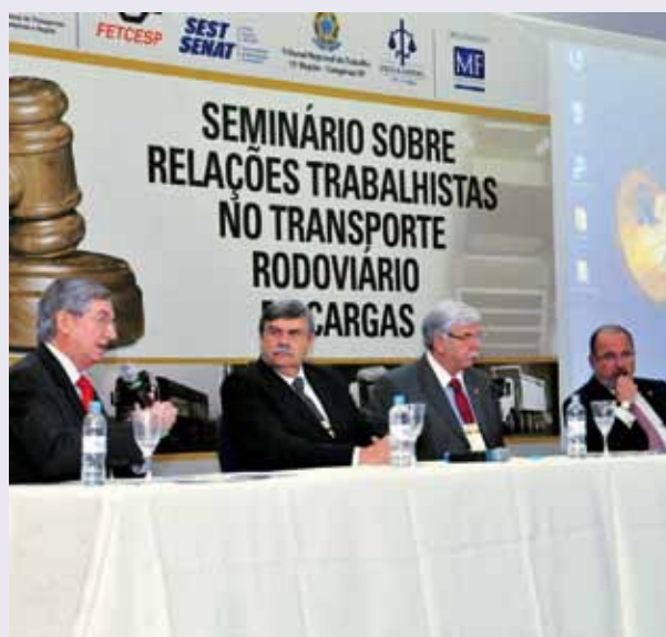
4º Seminário sobre Relações Trabalhistas no Transporte Rodoviário