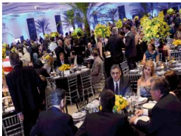
Sucesso no jantar e encerramento do Programa Inovação Empresarial de 2011

Dois empresas de transportes associadas ao Sindicamp foram homenageadas. A Transportadora Americana que completa 70 anos de atividades e a Transportadora Capivari que comemora 40 anos de fundação. O Sindicamp e os sindicatos profissionais das bases de Campinas