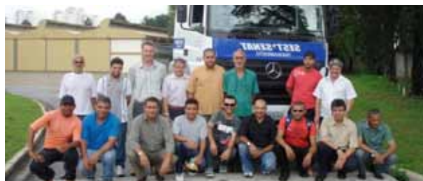
Primeira turma do curso capacitação de motoristas

No treinamento os alunos têm aulas de Cidadania; Meio ambiente; Matemática; Informática, Preparação para o mercado de trabalho; Segurança e saúde no trabalho; Legislação