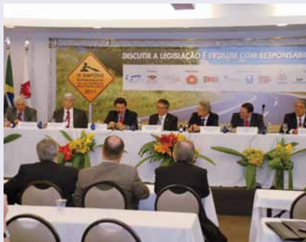
IX Simpósio de Responsabilidade Civil no Transporte Rodoviário de Cargas