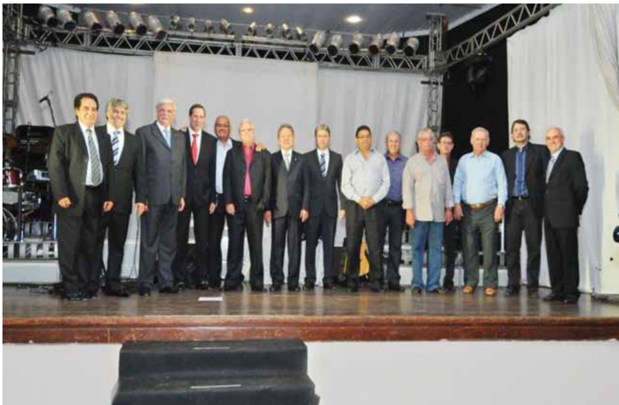
Festa de confraternização reuniu autoridades da região e empresários e lideranças do setor e familiares

Mais de 1500 pessoas participaram da tradicional festa de confraternização e jantar beneficente do Sindicato das Empresas de Transporte de Cargas de São José do Rio Preto (Setcarp) no último dia 18 de novembro. O Setcarp ainda sediou a reunião de diretoria plena da FETCESP para discutir a infraestrutura de transportes, segurança, novas tecnologias dos caminhões, meio ambiente, transporte de produtos perigosos e regulamentação da profissão de motorista, entre outros temas.