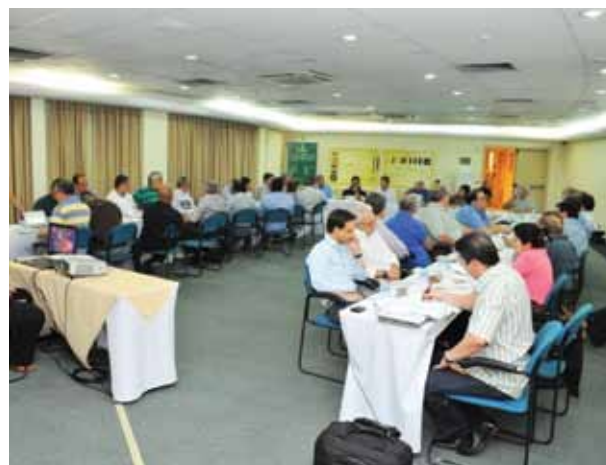
Reunião de diretoria da FETCESP em São José do Rio Preto

As verbas arrecadadas com as vendas dos convites foram direcionadas para entidades filantrópicas da região. A Associação de Beneficência Espírito Consolador recebeu recursos que viabilizou a doação de enxovais para recém nascidos e gestantes carentes atendidas pela entidade;