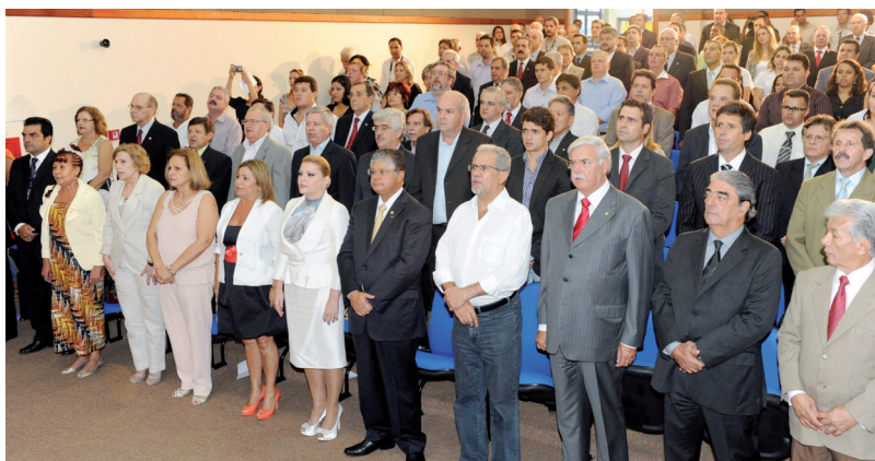
Lideranças do setor e autoridades da região na cerimônia de inauguração