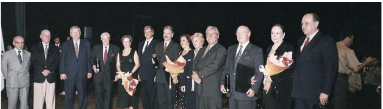
Cerimônia entrega Medalha FETCESP, em 1996

ICMS - O Imposto sobre Circulação de Mercadorias e Serviços (ICMS), quando foi implantado para o serviço de transporte, tinha uma proposta de alíquota interna de 17%. Foi através de atuação da FETCESP que se conseguiu a aprovação de emenda na Assembleia Legislativa, reduzindo a alíquota para 12%, sendo o Estado de São Paulo o primeiro a ter alíquota reduzida.