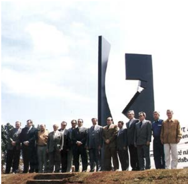
Inauguração Obelisco na Rodovia Adalberto Panzan, em 2003