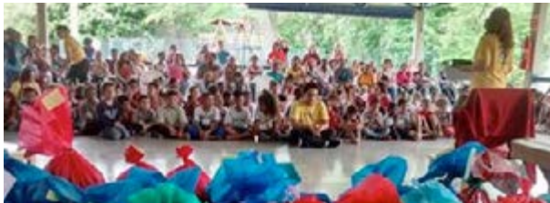
Crianças recebem presentes doados por padrinhos

No mês de dezembro, a Unidade Parque Novo Mundo realizou dois eventos. No Dia Mundial do Combate a AIDS, em 2 de dezembro, a médica Carina Lordello Dietrich fez palestra chamando atenção para a prevenção da doença. Também foram distribuídas camisinhas. Na festa de fim de ano do Lar Nefesh, em 5 de dezembro, foram distribuídos presentes doados por padrinhos para 120 crianças.