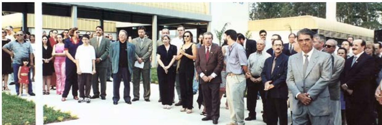
Inauguração do Sest Senat Sorocaba, em 2001

Com o passar dos anos outros estados também reduziram alíquota. Ainda sobre o ICMS, destaca-se outra importante conquista que é a autorização para que a empresa de transporte de carga possa utilizar o crédito presumido do ICMS na aquisição de caminhões, na fase em que o setor estava no regime da substituição tributária. O ganho financeiro então foi grande, permitindo às empresas renovar ou expandir sua frota sem qualquer desembolso. Com o fim da substituição tributária houve a conquista da manutenção do direito ao crédito presumido e sua livre utilização pela empresa de transporte. Neste tema, outra conquista foi a dilação do prazo de recolhimento do ICMS do terceiro dia útil do mês, para o vigésimo. A medida produziu as condições para um melhor fluxo de caixa das empresas de transporte.