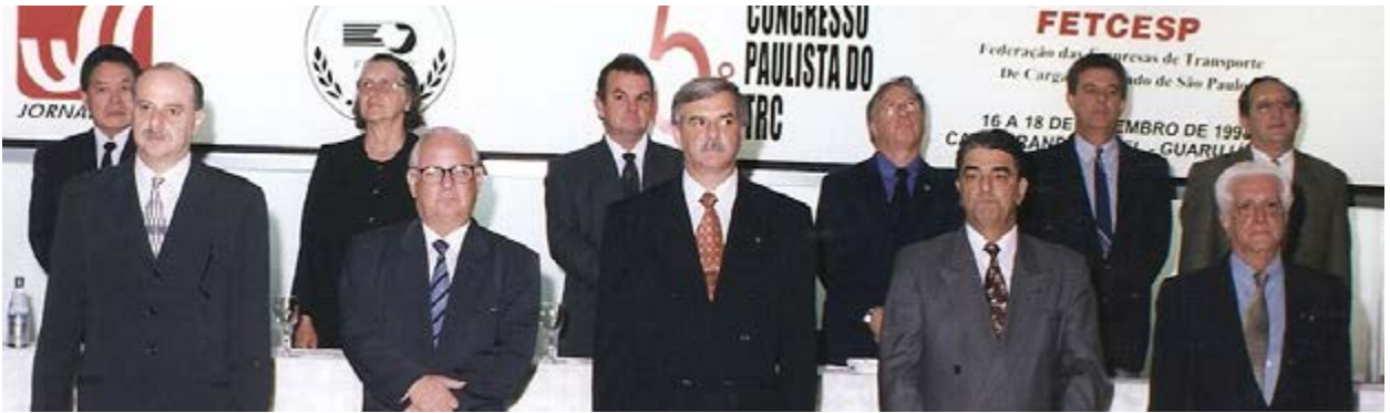
5º Congresso Paulista do TRC, em 1998

Valorização - A valorização das pessoas se faz presente também nas atividades da FETCESP que promove, desde 1992, a entrega da Medalha Mérito do TRC Paulista, as personalidades que prestam ou tenham prestado relevantes serviços ao setor. A comenda é distinguida nas Categorias Político; Líder Sindical; Empresário do TRC e Especial. Em 1996 a Medalha passou a levar o nome de Adalberto Panzan, em homenagem ao líder sindical que a criou.