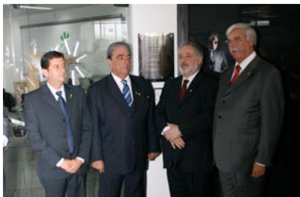
Inauguração da primeira Unidade Sicredi Fetcoop, em 2011

relacionamento com a SSP/SP e os organismos policiais federais e estaduais sediados no Estado, o que permite encaminhar de forma direta, oportuna e objetiva as demandas do setor junto às autoridades pertinentes.