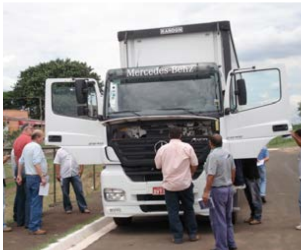
Motoristas no curso do Sest Senat da Unidade Campinas, em 2010

Projeto Despoluir - A preocupação com as questões ambientais ganha mais destaque na FETCESP culminando com sua adesão em 1997 ao projeto de controle de emissões geradas por motores diesel, iniciativa da Compet, CNT, Ministério das Minas e Energia entre outros órgãos. Atualmente em parceria com a CNT e Sest Senat, através do Programa Despoluir, a FETCESP atua no Estado de São Paulo com cinco veículos que ficam nos Sindicatos do ABC (Setrans), Campinas (Sindicamp), São José do Rio Preto (Setcarp) e Sorocaba (Setcarso) e na sede da Federação, para realizar aferições da emissão de poluentes dos motores diesel. Estes veículos são equipados com o opacímetro. Através de um software que registra os dados dos testes, pode-se avaliar se as emissões dos caminhões estão dentro dos parâmetros estabelecidos pelo Conselho Nacional do Meio Ambiente (Conama). Para incentivar às empresas que adotam boas práticas de controle e gerenciamento das emissões, o caminhão aprovado no teste recebe o Selo do Despoluir com validade de até um ano. O técnico responsável pela realização do teste, durante sua visita na empresa de transporte, recomenda a necessidade de manutenção de caminhões e orienta sobre os procedimentos corretos de armazenagem do diesel e abastecimento.