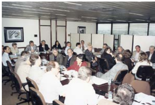
Reunião de diretoria plena da FETCESP, em 1999