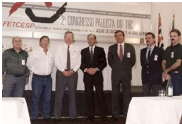
2º Congresso Paulista do TRC, em 1992

A FETCESP também participa do Conselho Estadual de Defesa do Contribuinte (Codecon), instalado em 2003, pelo governador Geraldo Alckmin. O Codecon é um órgão de defesa do contribuinte de tributos estadual. Recebe queixas e reclamações de pessoas físicas e jurídicas e está estruturado de forma paritária, composto por diversas entidades, representantes do poder público, de setores empresariais e de classe.