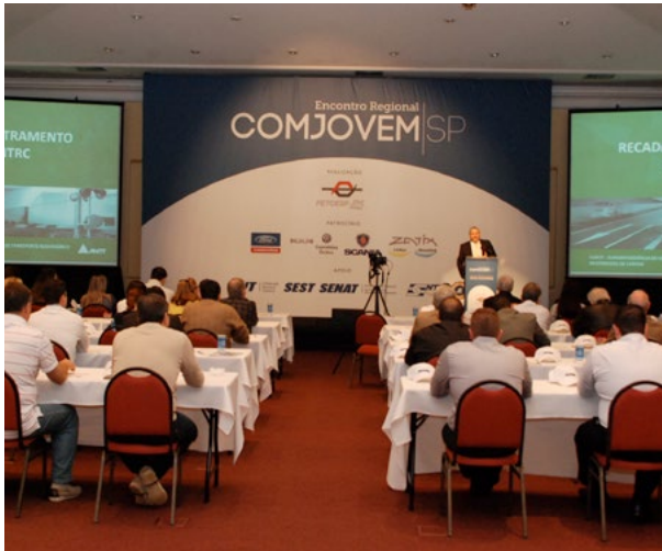
Jovens executivos, diretores e lideranças do setor no Encontro Regional