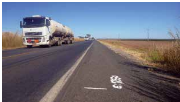
Rodovia na Bahia