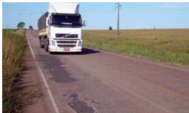
Rodovia no Mato Grosso

A comparação com as concessionadas mostra que as maiores dificuldades estão nas rodovias mantidas pelos governos federal e estaduais. Em relação ao estado geral, apenas 2,7% da extensão sob gestão pública foi considerada ótima e 24% boa. Já em relação ao estado geral das concedidas, os percentuais de classificação de extensão ótima e boa são de 48,5% e de 35,9%, respectivamente.