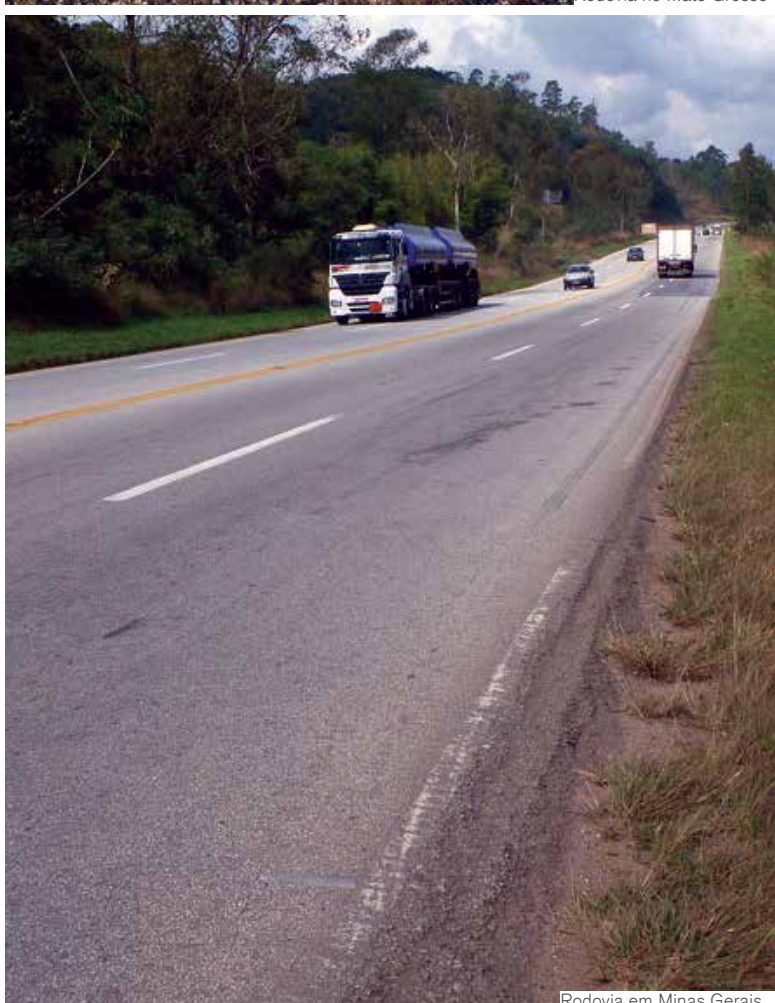
Rodovia em Minas Gerais

LEVANTAMENTO Pesquisa CNT de Rodovias aponta problemas em 63,8% da extensão avaliada Páginas 6 e 7