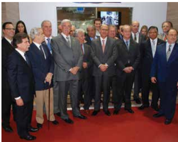
Governador Geraldo Alckmin e Flávio Benatti, presidente da FETCESP e NTC, com autoridades, lideranças e empresários do setor

Na abertura da Fenatran as autoridades falaram sobre a importância de renovar a frota de caminhões. O governador do Estado de São Paulo, Geraldo Alckmin, destacou a importância do evento e a participação dos envolvidos na cadeia produtiva. Ele comentou os investimentos feitos na infraestrutura do Estado, como as obras do Rodoanel leste e norte e a expansão das linhas do metrô. Alckmin mencionou o programa Renova São Paulo voltado aos caminhoneiros que possibilita a troca de um caminhão velho por um novo, com a condição do antigo ser entregue à reciclagem. O presidente da Confederação Nacional do Transporte (CNT), senador Clésio Andrade, destacou que a CNT lançou em 2009 o Plano Nacional de Renovação de Frota (RenovAR). Conforme explicou, o projeto foi desenvolvido levando em consideração a idade avançada dos caminhões em circulação no país, e que reduzem a produtividade do transporte e aumentam os custos de manutenção.