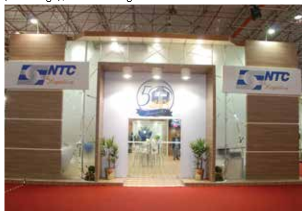
Estande da NTC para comemorar 50 anos