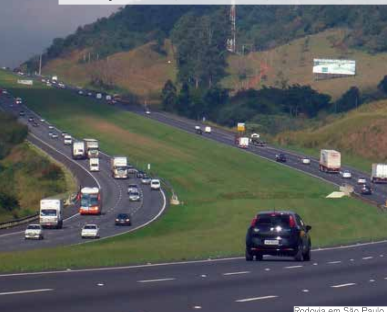
Rodovia em São Paulo

Federação das Empresas de Transporte de Cargas do Estado de São Paulo | Ano XV | N° 180 | Novembro de 2013