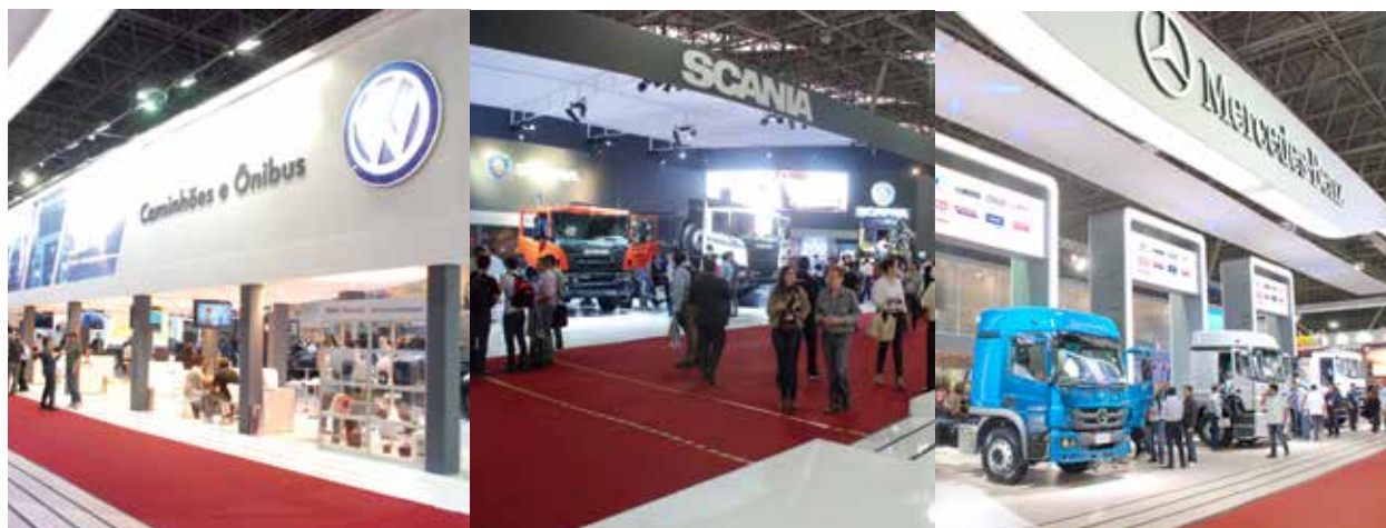
Novidades e muita tecnologia nos estandes das montadoras

com combustível B20 (diesel com adição de 20% de biodiesel), que passa a equipar todos os caminhões da linha Cargo 2014. A MAN Latin America apresentou os novos cavalos mecânicos produzidos pela montadora. A linha ganha mais potência, com os modelos Constellation 19.420, 25.420 e 26.420. Além do motor Cummins de 420 cavalos, os veículos chegam equipados com a transmissão automatizada de série V-Tronic. A versão leito teto baixo da cabine Constellation completa as novidades da linha. A montadora ainda mostrou o cavalo mecânico TGX 29.480 6x4, que deve ser lançado em meados de 2014.