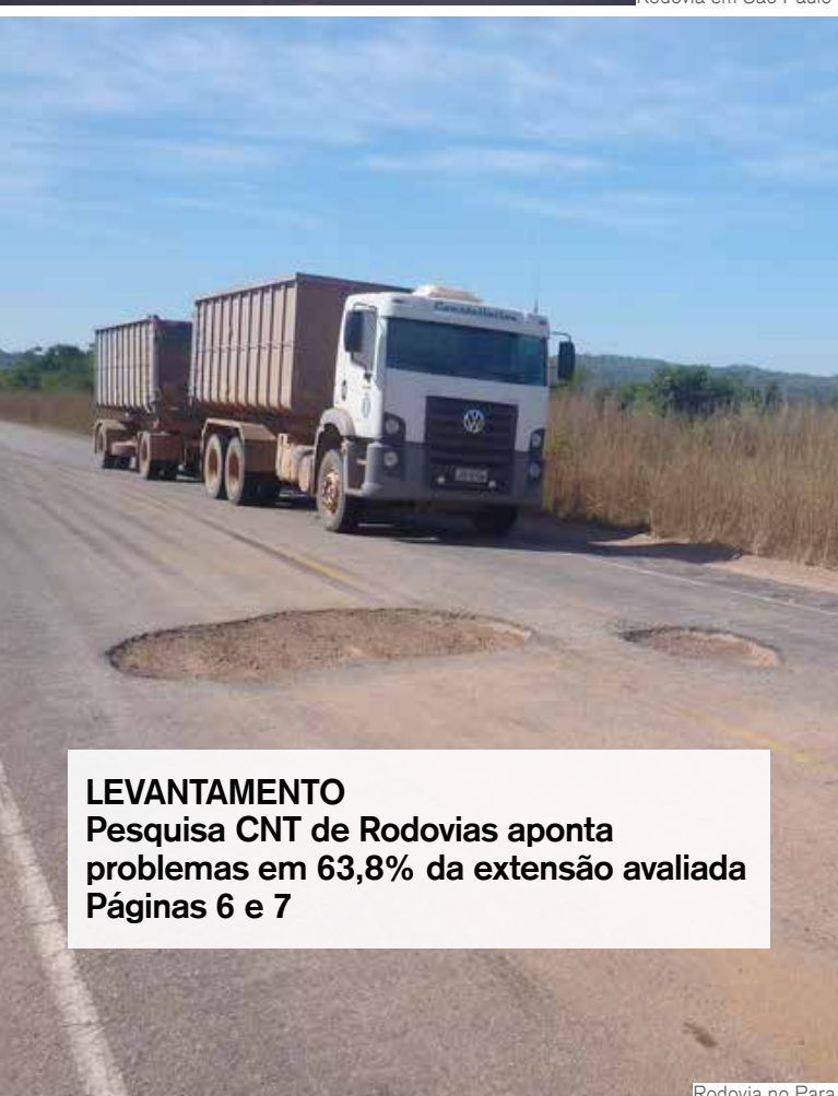
Rodovia no Para

LEVANTAMENTO Pesquisa CNT de Rodovias aponta problemas em 63,8% da extensão avaliada Páginas 6 e 7