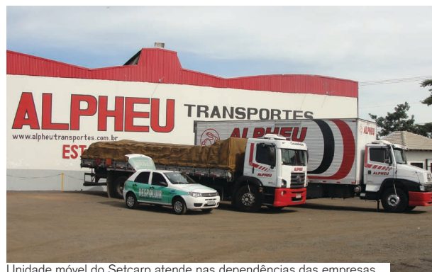
Unidade móvel do Setcarp atende nas dependências das empresas

A avaliação é feita com base nas normas do Conselho Nacional de Meio Ambiente (Conama), que estabelecem os critérios