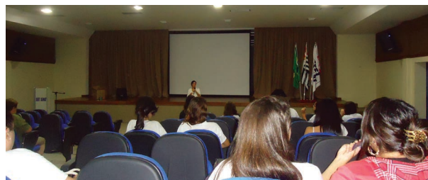
Atividades promovidas para as mulheres na Unidade Vila Jaguará

para a reflexão sobre as fases da vida; exercícios para melhoria da postura e saúde da coluna e curso de automaquiagem. O café da manhã e o chá da tarde promoveram a integração entre as 295 pessoas que participaram das atividades.