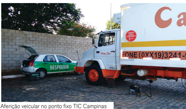
Aferição veicular no ponto fixo TIC Campinas

O veículo que estiver dentro dos padrões de emissão de poluentes recebe o Selo Despoluir com validade de seis meses.