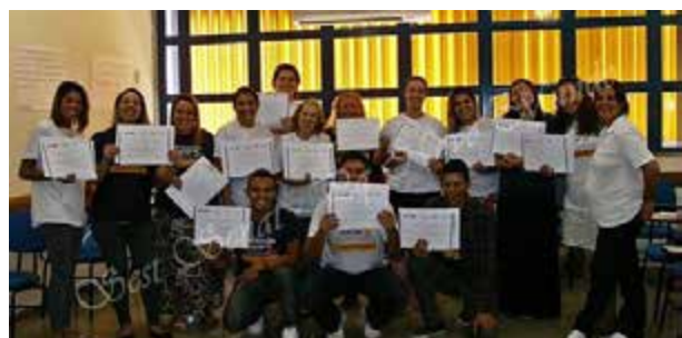
Formandos de curso do Pronatec

No mês de fevereiro a Unidade Parque Novo Mundo realizou a formatura de três turmas do Programa Nacional de Acesso ao Ensino Técnico e Emprego (Pronatec). Desta vez os alunos concluíram os cursos de Auxiliar de Recursos Humanos, Inglês Básico e Arrumador e Conferente de Carga. Para este ano o número de vagas nas Unidades do Sest Senat foram ampliadas, bem como os temas dos cursos. As inscrições já estão abertas e podem ser feitas através do site pronatec.mec.gov.br .