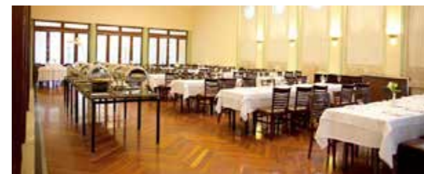
Grande Hotel referência em gastronomia

Com estrutura completa e serviços exclusivos, o Grande Hotel São Pedro tem a solução para receber os mais variados eventos corporativos e