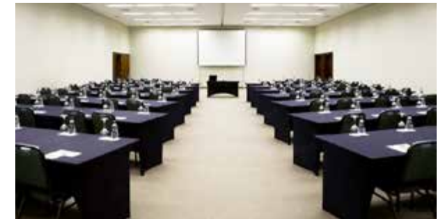
Salão de eventos comporta mais de 200 pessoas