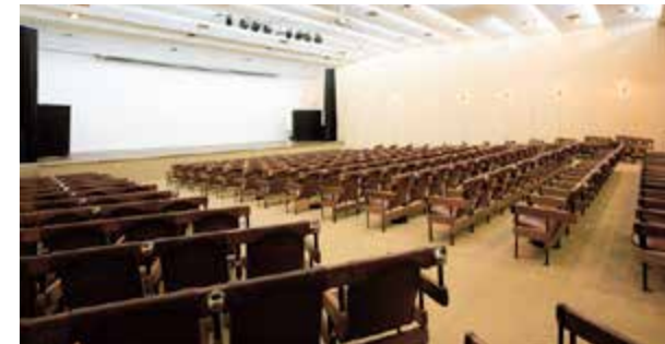
Auditório equipado tem capacidade para 300 pessoas

sociais. O Centro de Convenções possui 1.000 m² e capacidade para até 700 pessoas, podendo ser usado como auditório ou salas moduladas. O hotel também oferece serviços de coffee break , welcome drink , almoços e jantares, com várias opções de cardápio. Além disso, dispõe de Business Center , internet sem fio e Jardim de Inverno com cobertura. Em meio aos 330 mil m² de área verde, o Grande Hotel São Pedro dispõe de uma estrutura completa de lazer e esportes para os mais variados gostos e idades, com piscinas, campo de golfe, quadras de tênis, futebol e basquete, ginásio poliesportivo, sala de ginástica, circuito de cooper , trilhas para caminhadas, bicicletário e uma equipe de monitores profissionais.