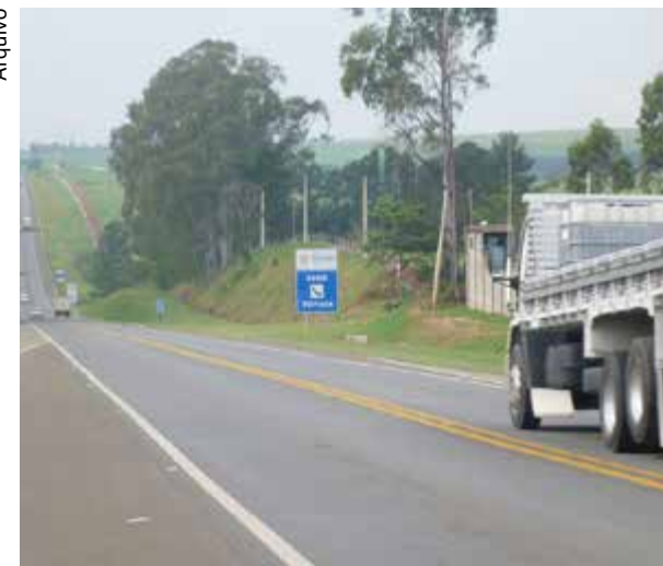
Lei 12.619/2012 está em vigor desde 17 de junho