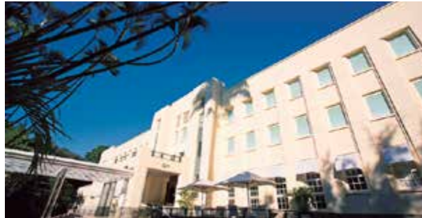
Prédio do Grande Hotel São Pedro apresenta imponente arquitetura Art Déco, rodeado por jardins e bosques

Palestras sobre política, economia, legislação no transporte e motivação serão promovidas no 13º Congresso Paulista do Transporte Rodoviário de Cargas que a FETCESP realizará nos dias 15, 16, 17 e 18 de maio, no Grande Hotel São Pedro, em Águas de São Pedro/SP. Todos os detalhes estão sendo criteriosamente analisados pela comissão organizadora deste Congresso que marcará as comemorações de 25 anos de atuação da FETCESP. A expectativa da comissão organizadora é repetir o sucesso das edições anteriores reunindo mais de 200 pessoas.