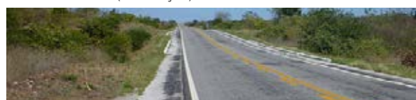
Paraíba - BR-361 (geometria)