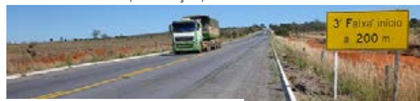
Goiás - BR-080 (pavimento)