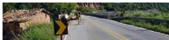
Alagoas - BR-424 (ponto crítico)