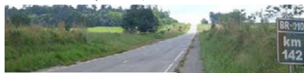
Pará - BR-010 (sinalização)