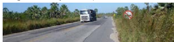
Ceará - BR-222 (sinalização)