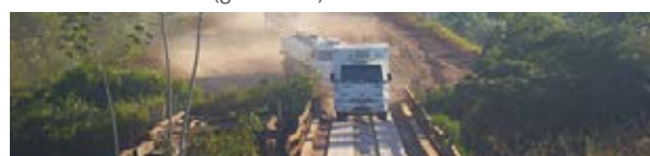
Rondônia - BR-429 (ponto crítico)

municípios de São Paulo e uma liga um município de São Paulo a um de Minas Gerais (Rio Claro a Itapetininga).