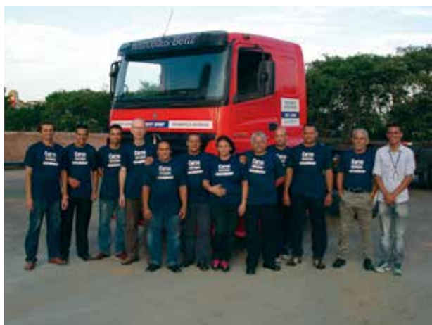
Especialização de motoristas na Unidade ABC com aulas práticas

Outra ação para viabilizar este grande projeto de formação e especialização dos motoristas é a utilização de simuladores de caminhões para aulas práticas que serão instalados em diversas Unidades. Também está em andamento um outro projeto do Conselho Nacional, informou Benatti, que é atender jovens carentes na formação completa de motorista através do Programa Nacional de Acesso ao Ensino Técnico e Emprego do governo federal (Pronatec).