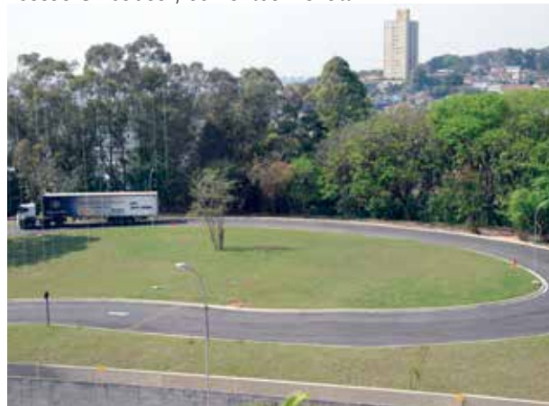
Pista para treinamentos na Unidade Vila Jaguara

Durante o ano as Unidades promoveram ações educativas e de conscientização de vários temas nas áreas da saúde, meio ambiente e segurança no trânsito entre outros. No campo do entretenimento e cultura as Unidades também estiveram oferecendo diversas atividades como canto coral, oficinas, teatro e futebol society, entre outras que reuniram trabalhadores e familiares. “O grande objetivo destas ações é melhorar a qualidade de vida dos trabalhadores em ambientes descontraídos e infraestrutura adequada como oferecem nossas Unidades”, comentou Benatti.