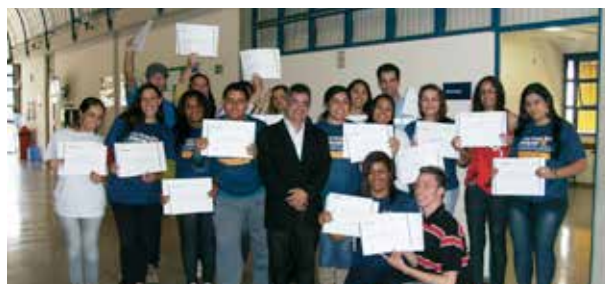
Alunos concluintes do curso Auxiliar Administrativo, do Pronatec

A Unidade Parque Novo Mundo entregou, no último dia 6 de agosto, certificados para mais uma turma do Programa Nacional de Acesso ao Ensino Técnico e Emprego (Pronatec), do Governo Federal. Desta vez os alunos concluíram o curso Auxiliar Administrativo de 160 horas. No momento a Unidade está pactuando mais vagas com o Ministério da Educação (MEC) para oferecer o curso de Inglês Básico pelo Pronatec Copa. O Pronatec tem como objetivo expandir, interiorizar e democratizar a oferta de cursos técnicos e profissionais de nível médio e cursos de formação inicial e continuada para trabalhadores.