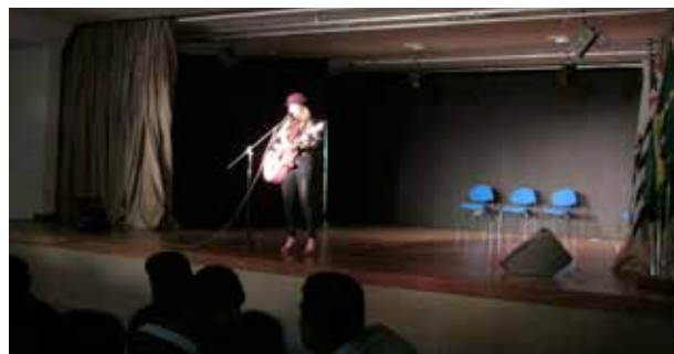
Diversas apresentações culturais reuniram 980 pessoas

As atividades culturais reuniram 980 pessoas que se divertiram com as atrações musicais, exibição de filmes, apresentação de danças e encenação de peça teatral.