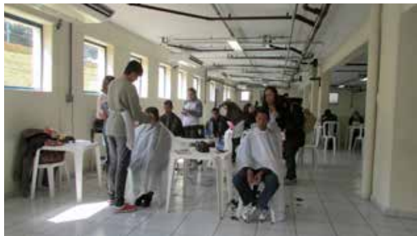
Serviços de estética pessoal para os participantes

O evento Transporte e Cidadania é uma ação da Confederação Nacional do Transporte (CNT), que preocupada em multiplicar suas ações de responsabilidade social e de cidadania, realiza através das unidades do Sest Senat, ações que promovam a melhoria da qualidade de vida e do desempenho profissional dos trabalhadores do transporte e seus familiares. O evento tem por objetivo a