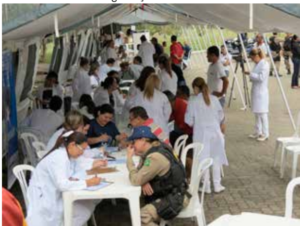
Comando da Saúde na rodovia Presidente Dutra, em Roseira/SP

Neste ano o evento tem como tema a "Saúde do Homem". Conforme o presidente da Confederação Nacional do Transporte (CNT) e do Sest Senat, senador Clésio Andrade, "a ação tem como foco oferecer melhores condições ao trabalhador do setor de transporte rodoviário. Motoristas com boa saúde dirigem melhor e mantêm a segurança nas nossas rodovias".