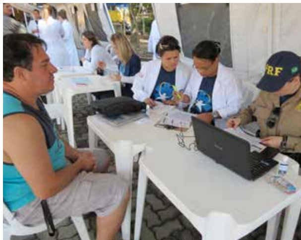
Motoristas também receberam orientações para prevenção de doenças

No ano passado, cerca de 9,2 mil caminhoneiros foram beneficiados pelo programa. A campanha, iniciada em 2006, já contou com a participação de mais de 70 mil motoristas em todo o território nacional. A quarta e última etapa do programa em 2013 está prevista para outubro.