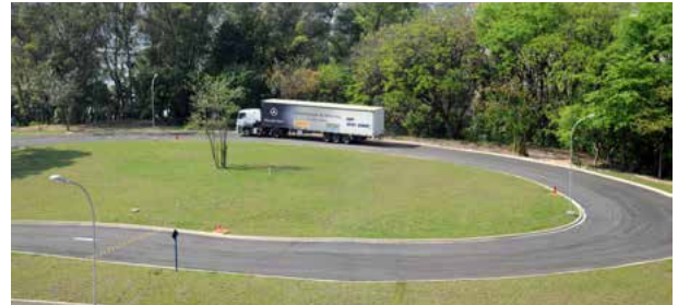
Pista de treinamentos da Unidade Vila Jaguará

e Carreta Engatados e Condução Segura e Direção Defensiva Preventiva. As empresas e profissionais interessados neste programa devem entrar em contato com a unidade pelo telefone (11) 3623-316 ou e-mail anaangelica@sestsenat.org.br .