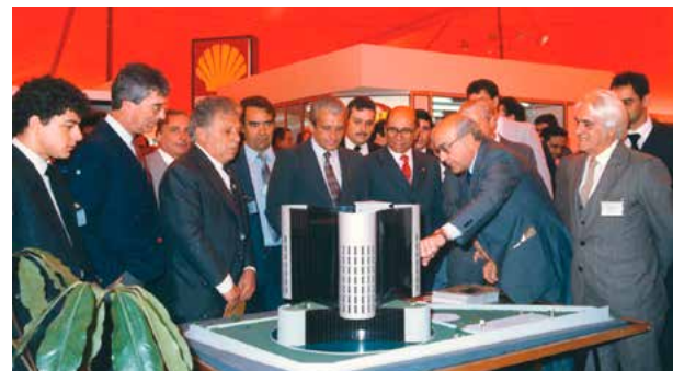
Maquete da sede do Sindicato apresentada no evento comemorativo de 50 anos do Setcesp