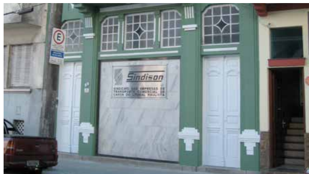
Sede do Sindisan no centro histórico de Santos